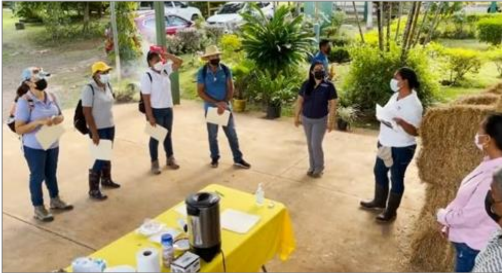
Figura 2. Capacitación teórica al grupo de apicultores de DEUMSA.