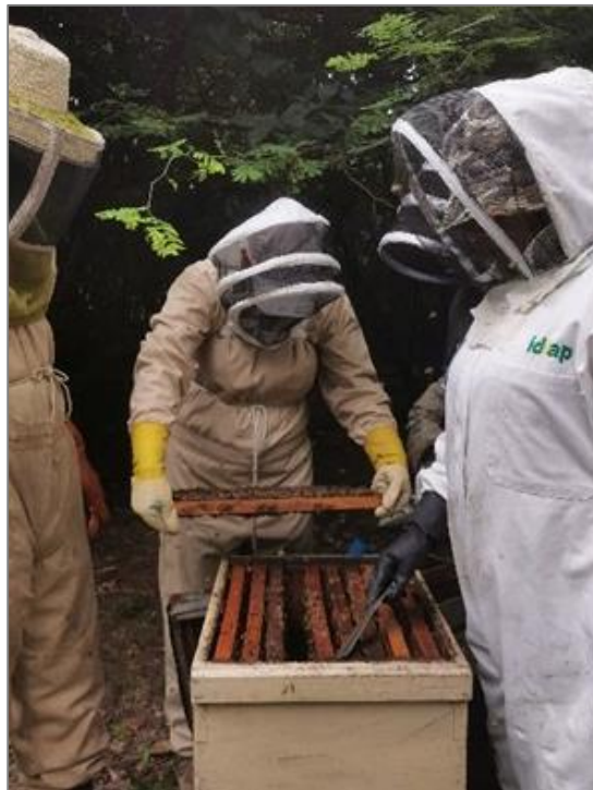
Figura 3. Talleres en campo con el grupo de apicultores DEUMSA.